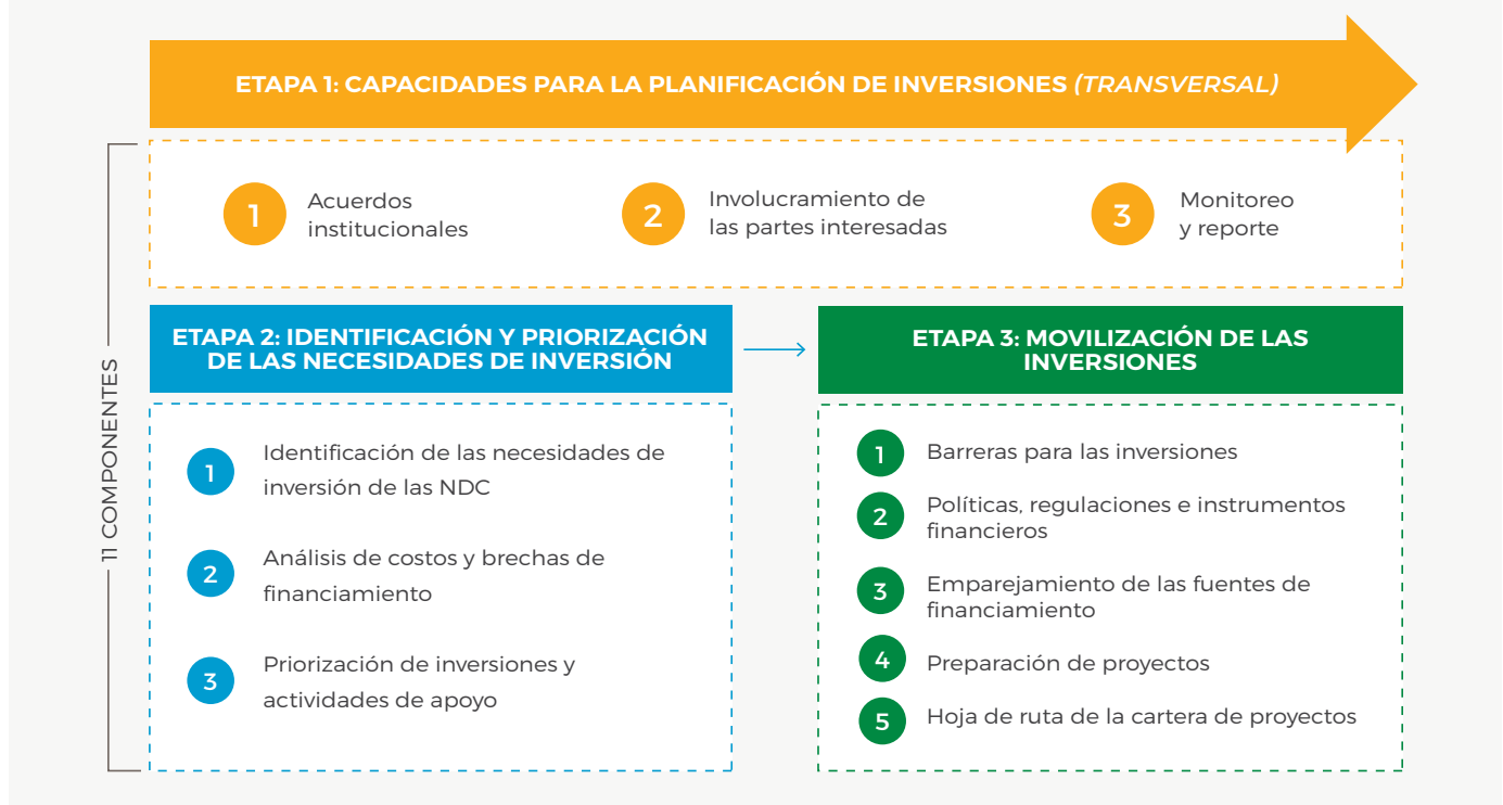
FIGURA 2. ETAPAS Y COMPONENTES DE LA PLANIFICACIÓN DE INVERSIONES DE LAS NDC

Mediante una secuencia ilustrativa y un abanico de productos que pueden utilizarse para avanzar en la planificación de inversiones de las NDC, la Guía pretende ayudar a los gobiernos y a otras partes interesadas a transitar estos complejos procesos, desde la identificación de las necesidades hasta la movilización de los recursos. En síntesis, la Guía puede ser muy útil para los siguientes cuatro grupos de partes interesadas: (1) los países miembros de NDC Partnership (p. ej., los ministerios de finanzas y medio ambiente y otras entidades ejecutoras de proyectos), (2) los socios financieros e implementadores (p. ej., los bancos multilaterales de desarrollo, los fondos climáticos y otros instrumentos multilaterales/bilaterales de financiamiento), (3) el sector privado (p. ej., fondos de inversión y gestores de activos, y filantropías interesadas en cómo los países originan, priorizan y promueven proyectos de inversión alineados con las NDC) y (4) organizaciones de la sociedad civil (p. ej., grupos u organizaciones que desempeñan un papel en la construcción de resiliencia comunitaria y que defienden intereses sociales específicos y objetivos climáticos a nivel nacional).